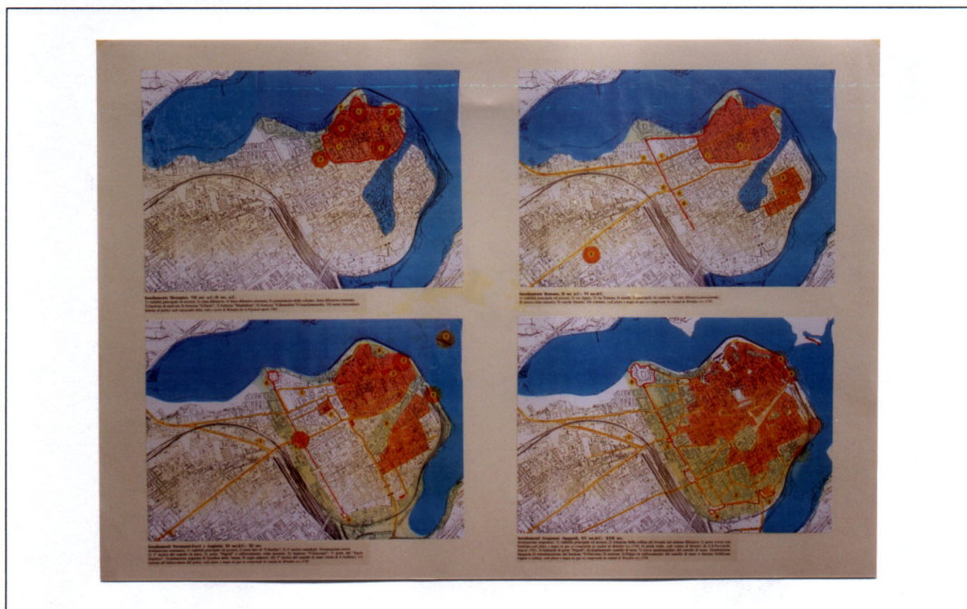
Tavola 3, sc. 1:5.000 — EVOLUZIONE STORICA: DAI MESSAPI ALLA DOMINANZA SPAGNOLA

Ricostruzione dei percorsi viari, identificazione delle emergenze architettoniche Insediamenti Messapico, VII sec. a.C.-II sec. a.C.- Romano, II sec a.C.- VI sec.d.C.- Normanni, Svevi e Angioini, XI sec.d.C.- XI sec. - Aragonesi -Spagnoli, XV sec.d.C.- XVII sec. Riproduzione del "plano y mapa en que se comprende la ciudad de Brindisi ecc.1739" con i profili del sistema difensivo emergente.